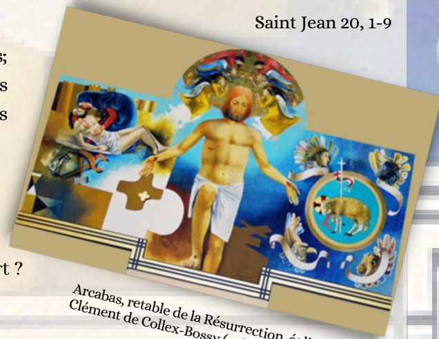
Arcabas, retable de la Résurrection, église Saint-Clément de Collex-Bossy (près de Genève), 2001.

Jésus ressuscité nous envoie porter la nouvelle de sa résurrection à tous; Marie est l'un des premiers témoins, elle est aussi l'un des premiers messagers de cette bonne nouvelle puis viennent Simon-Pierre, les disciples et... nous aujourd'hui !